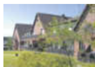
Rundum gut versorgt

BETREUTE WOHN- GEMEINSCHAFT im SENIORENLANDSITZ