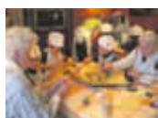
Bewohner so betreuen, wie man es selbst gern hätte