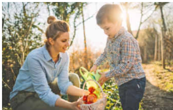
Für die Kleinen und die Großen ist die Ostereiersuche ein toller Spaß.

Im Mittelalter wurden Eier als Zahlungsmittel an Landesherren oder im Tauschgeschäft verwendet. Auch galten sie von jeher als Zeichen der Fruchtbarkeit und wurden verschenkt, um die heidnische Göttin Ostara zu ehren. Eine Überlieferung besagt, dass dieser Brauch der Kirche missfiel und verboten wurde. Um sich bei der Fortsetzung dieses Rituals nicht erwischen zu lassen, haben die Anhänger die Eier nicht mehr persönlich verschenkt, sondern auf den Feldern von Freunden und Familie vergraben und versteckt, wo sie gesucht werden mussten.