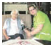
In guten Händen

BETREUTE WOHN- GEMEINSCHAFT im SENIORENLANDSITZ