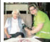
In guten Händen

BETREUTE WOHN- GEMEINSCHAFT im SENIORENLANDSITZ