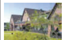
Rundum gut versorgt

BETREUTE WOHN- GEMEINSCHAFT im SENIORENLANDSITZ